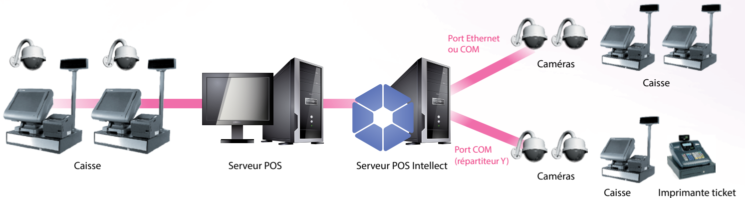
Schéma du système POS Intellect